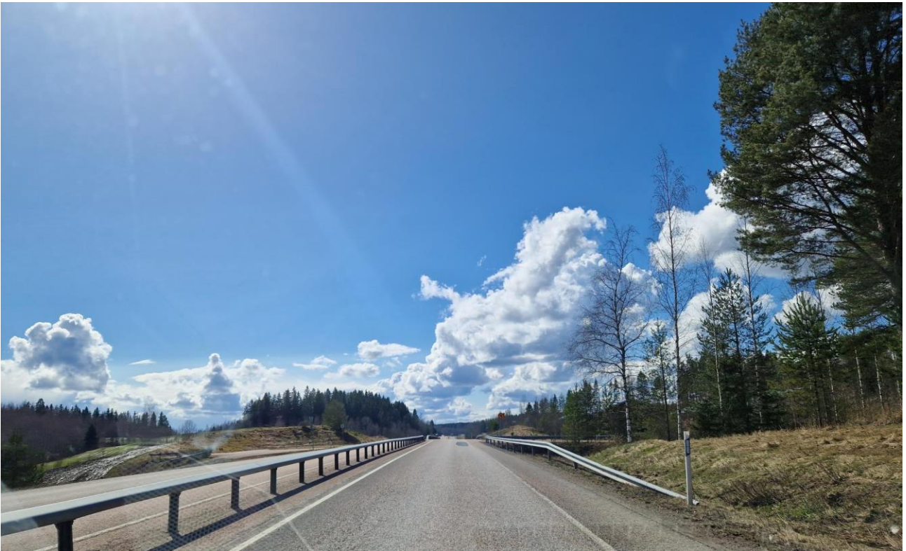
Kuva: Ysitien varrelta keväällä 2023

Vaikuttajaverkoston toiveiden mukaista säännöllistä ja informatiivista yhteydenpitoa päästään toden teolla jatkamaan yhteysvälivastaavien kanssa heti alkavana keväänä. Yhdistyksen visuaalisen ilmeen ja verkkosivun päivittäminen edesauttavat yhdistyksen ja sitä kautta Ysiväylän tunnettuutta. Merkittävien elinkeinoelämän toimijoiden, kuten isot liikennöitsijät tai logistiikka-alan yrittäjät voisivat olla yksi tulevaisuuden vahvistettava kontaktipinta.