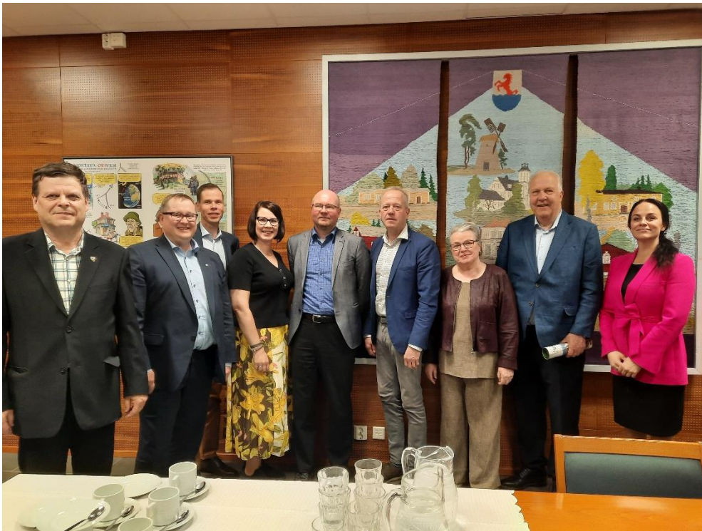
Kuva: Vuosikokous Orivedellä 26.5.2023