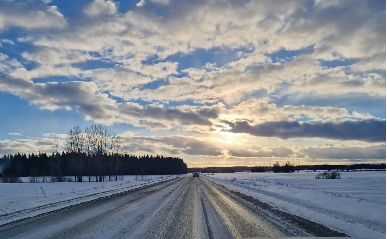
Kuva: Ysitiien varrelta kevättalvella 2023